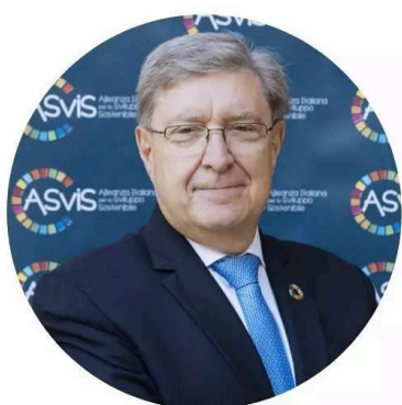
Il Direttore scientifico Enrico Giovannini

“ Siamo ostinati ma non ciechi. E neanche ingenui. La sostenibilità non è un fastidio, ma un investimento sul presente e sul futuro ”