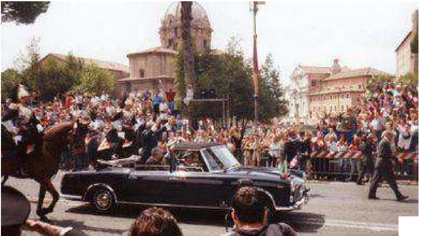
▲ Il Presidente della Repubblica Carlo Azeglio Ciampi alla parata del 2 giugno 2002

Nel 1961 la celebrazione principale della Festa della Repubblica però non ebbe luogo a Roma, ma a Torino, prima capitale dell'Italia unita, dal 1861 al 1865. Mentre a causa della grave crisi economica che colpì l'Italia negli anni 1970 , per contenere i costi statali e sociali, nel 1977 la Festa della Repubblica fu resa una “ festa mobile ” e cioè spostata alla prima domenica di giugno, con la conseguente soppressione del 2 giugno come giorno festivo.